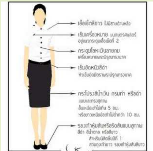
ชุดพิธีการ (นิสิตหญิง)