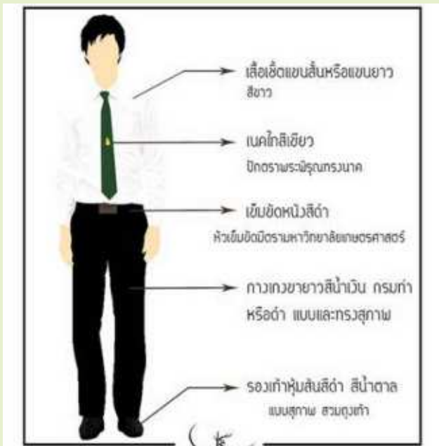
ชุดพิธีการ (นิสิตชาย)